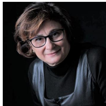
ARCHITECT, EUROPEAN CERTIFIED ERGONOMIST, Expert in Ergonomics and Design for All