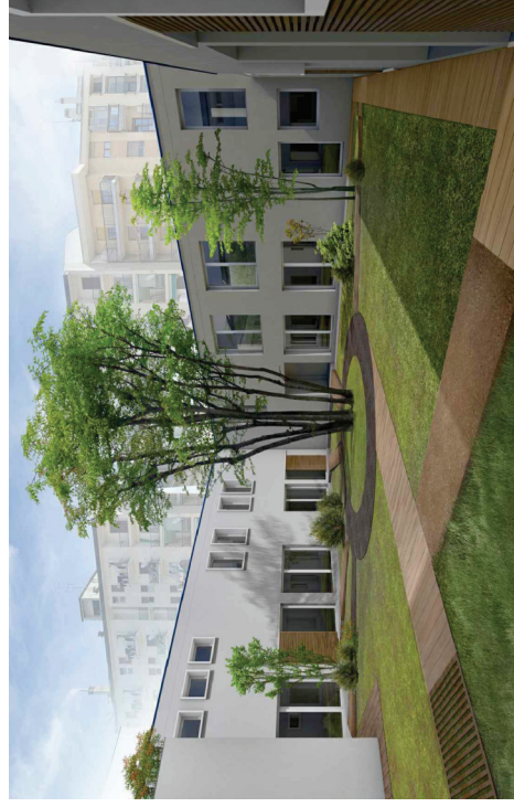
VISTA DELLA CORTE (3)