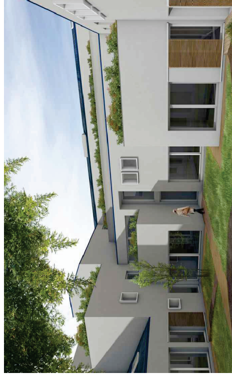
VISTA DELLA CORTE DAL LATO DELL'INGRESSO (4)