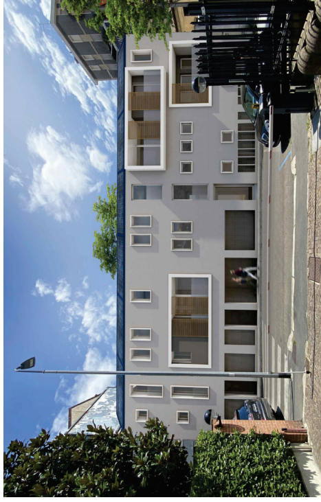
VISTA DELLA FACCIATA LUNGO VIA DAVANZATI (1)